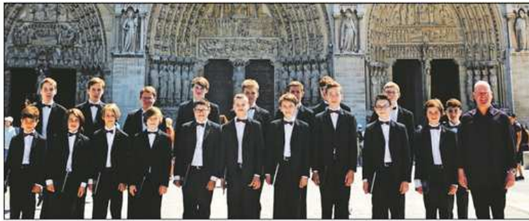
Unterstützung aus Nordrhein-Westfalen: Der Knabenchor Hösel ist einer von gleich vier Chören, die in der Stiftskirche zu hören sein werden.